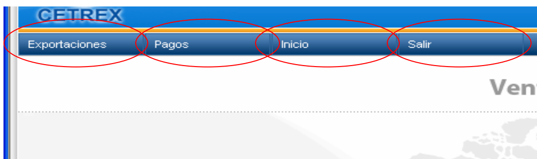
Fig.3: Página principal del Sistema

Si el usuario ha digitado correctamente sus datos y el Sistema no lo reconoce deberá llamar a las oficinas centrales de CETREX para solucionar el problema del Login.