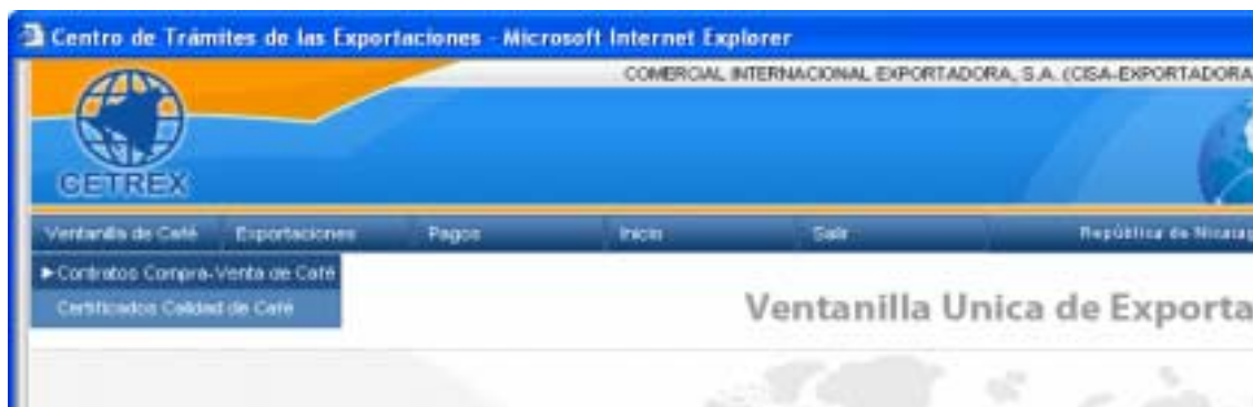
Fig. 52: Ventanilla de Café

Contratos Compra-Venta de Café: es la opción que se elige para registrar los contratos de compra-venta de Café, que son establecidos entre los exportadores y sus clientes. El registro de los contratos constituye el primer paso para realizar los trámites de exportación de café.