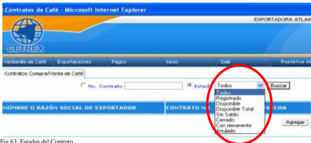
Fig.63: Estados del Contrato