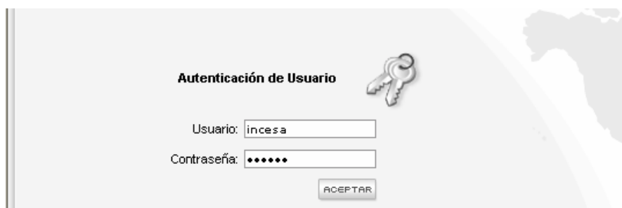
Fig.2: Autenticación de Usuario

El Sistema muestra una página de Autenticación de Usuario , donde hay dos casillas en las que el exportador debe ingresar el Nombre de Usuario y la Contraseña asignada por el CETREX, al momento de la suscripción del contrato por el servicio en línea.