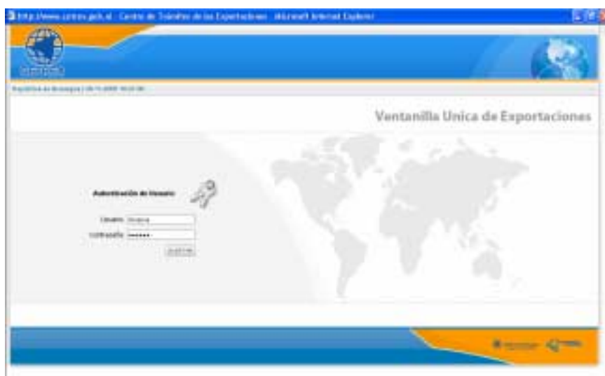
Fig. 51: Autenticación de Usuario

El Sistema muestra una página de Autenticación de Usuario , donde hay dos casillas en las que el exportador debe ingresar el Nombre de Usuario y la Contraseña asignada por el CETREX, al momento de la suscripción del contrato por el servicio en línea.